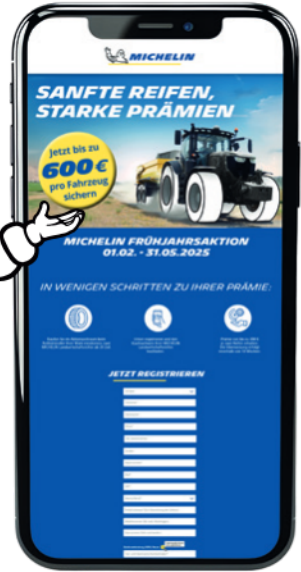
Abbildung und Inhalte ähnlich